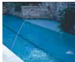
Un chorro de 1/4"