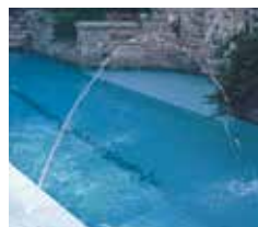
Un chorro de 5/16"