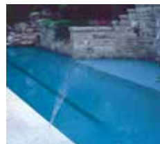
Rociado en abanico

Los primeros decorativos acuáticos se diseñaron para aplicaciones comerciales y, posteriormente, se adaptaron para el uso residencial. El resultado fue el exceso de ingeniería y altos precios. El chorro de agua Deck Jet de Pentair está diseñado específicamente para el uso residencial, con materiales de construcción y técnicas de fabricación que permiten costos más bajos. La construcción totalmente de plástico de las piezas reduce los costos iniciales y de toda la vida útil del sistema, a la vez que proporciona un funcionamiento sin problemas con poco o ningún mantenimiento.