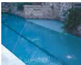
Un chorro de 3/16"